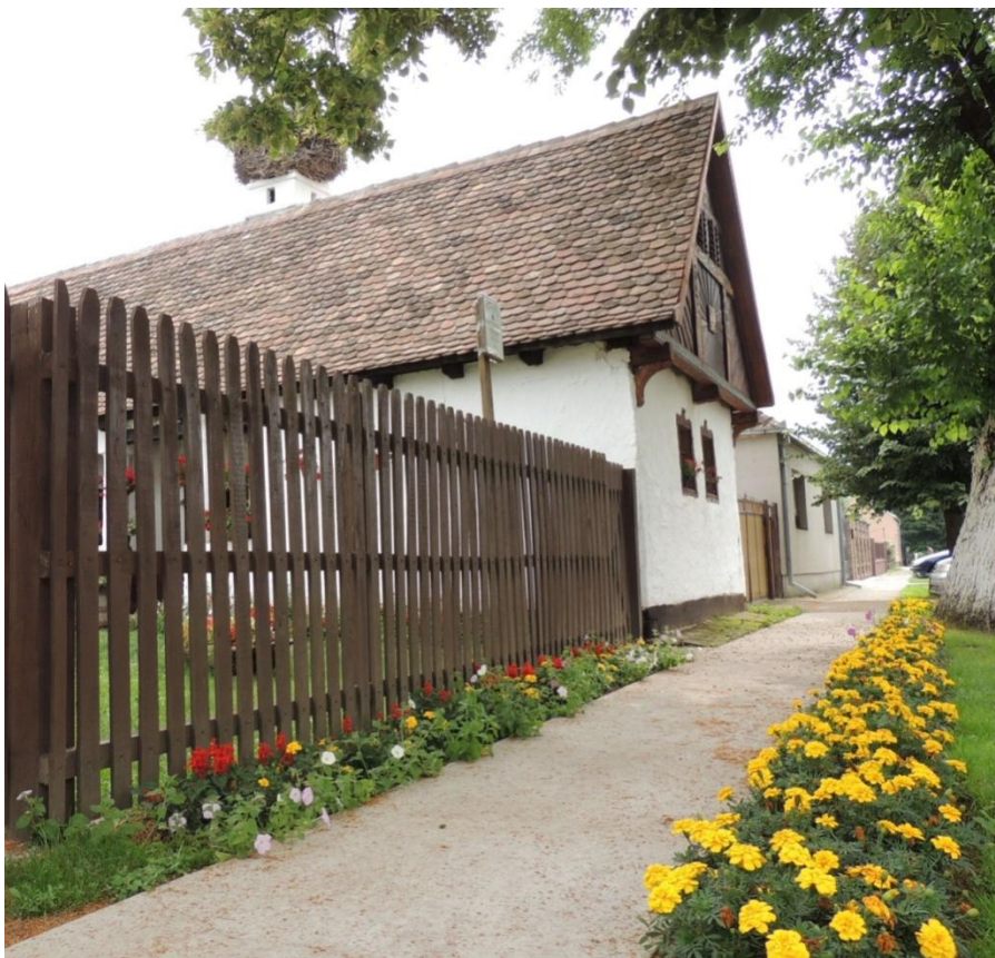
Слика 5. Аксентијев кућерак у Огару

последње три године уложио много труда и средстава добијених преко пројеката, што нам говори о значају ове куће за етнолигију и културу Срема. У дворишту Етно куће је направљен летњиковац и ђерам, а деци су на располагању и лопте и голови за игру, а у плану је и постављање дрвоног дечјег игралишта.