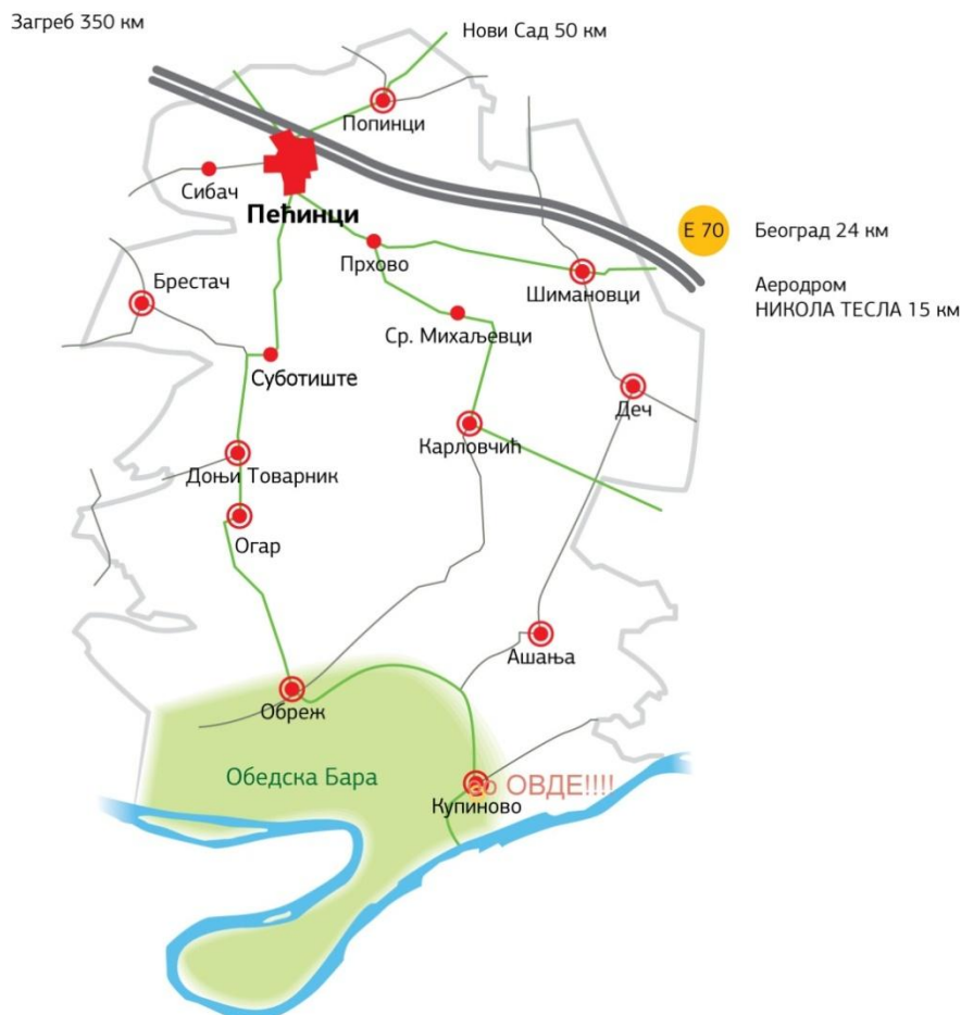
Слика 4. Мапа општине Пећинци

Рутом је повезан крајњи север и југ општине Пећинци, тј. села - Пећинци и Купиново, а у сваком насељу кроз које се пролази мапирано је нешто интересно и препоручено туристима.