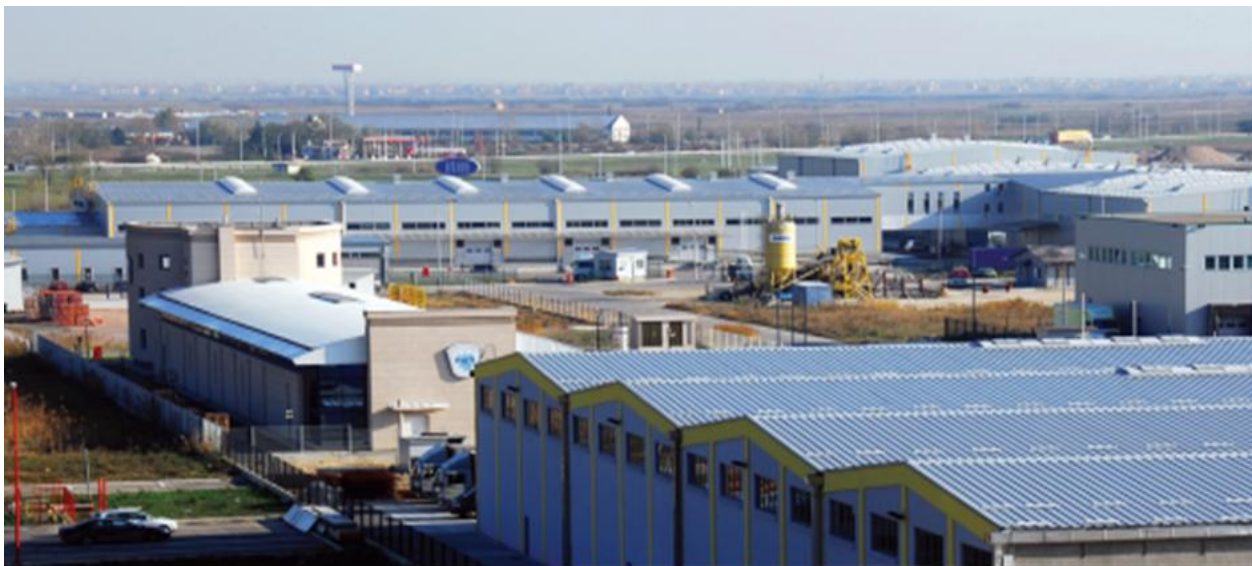
Слика 2. Радна зона Шимановци

тржиштем квалитетне радне снаге. Налазимо се на удаљености од 25 км од Београда и 15 км од међународног аеродрома „Никола Тесла“. Кроз северни део Општине пролази ауто-пут Е-70 који је крак европског коридора 10. У зони ауто-пута Е 70 у Радној зони Шимановци до сада је реализован највећи број инвестиција, уз стално интересовање нових инвеститора за реализацију нових пројеката.