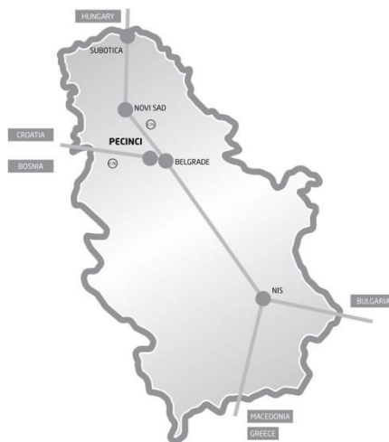
Слика 3. Географски и саобраћајни положај општине Пећинци на карти Р. Србије

Простор на коме се простира општина Пећинци обилује изузетним природним и културно-историјским лепотама и вредностима погодним за развој туризма. Обедска бара, река Сава, велика пространства аутохтоних храстових и других шума, богата и разноврсна флора и фауна, али и споменици културе из средњег века, раритети народног градитељства, музеј - јединствен на овим просторима, само су део богатства које завређује туристичку валоризацију.