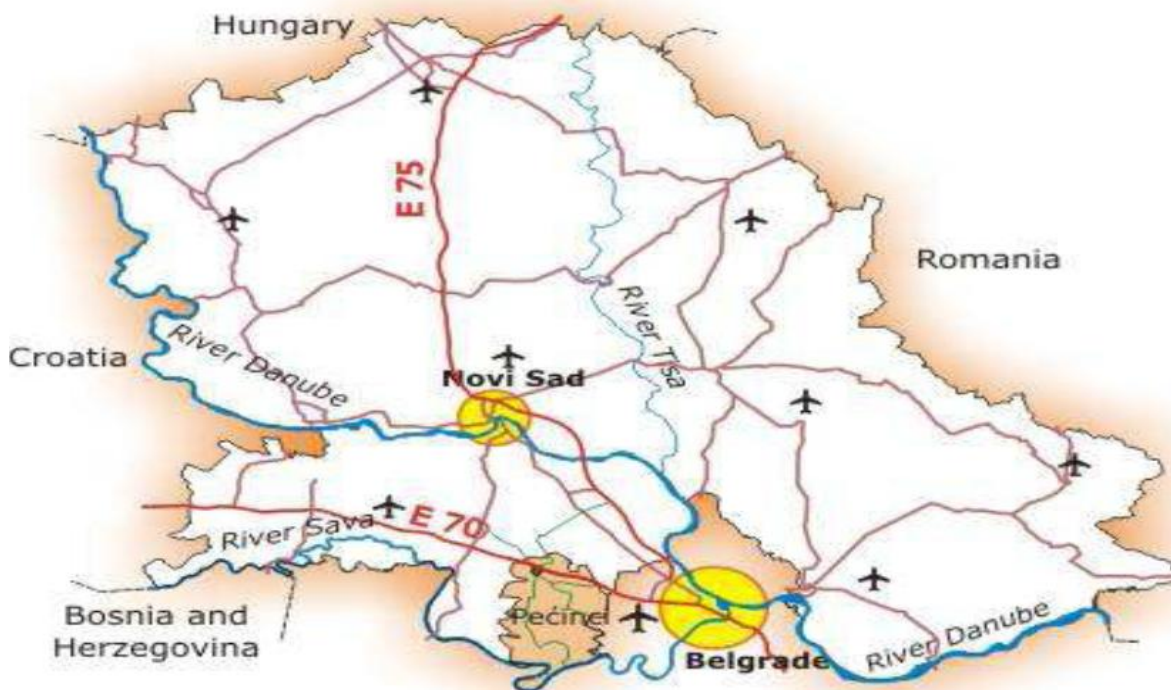
Слика 1. Мапа АП Војводине

Општина Пећинци лоцирана је у Доњем, равном Срему, који се у овом делу назива још и Подлужје. На истоку општина Пећинци се граничи са београдским подручјем, на североистоку са општином Стара Пазова, на северу и западу са општином Рума, а на југу границу чини река Сава. Општинско подручје има неправилан облик.