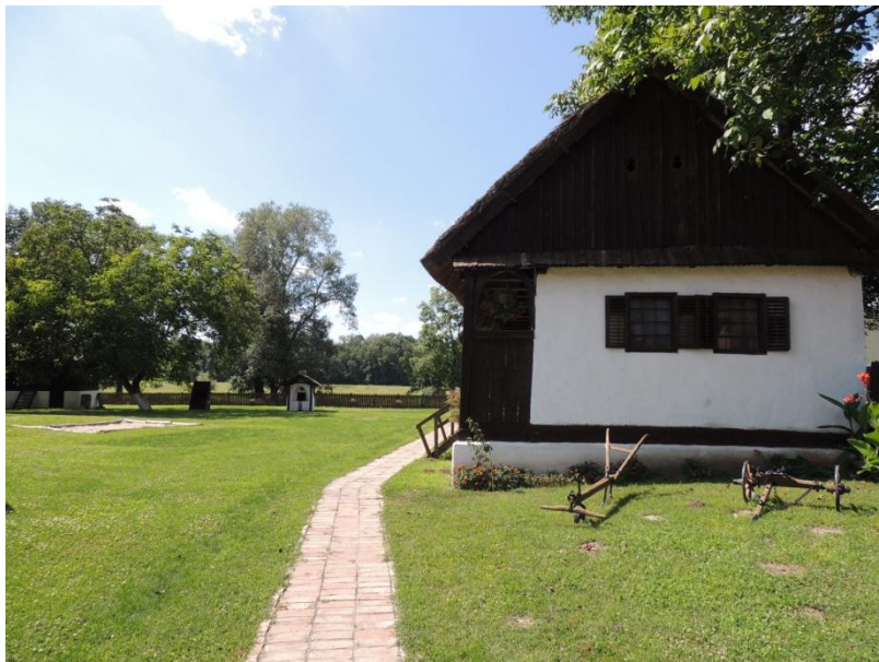
Слика 7. Етно кућа Купиново

Типичан пример народног градитељства с краја XVIII века, је кућа породице Путник. Ова етно-кућа са помоћним објектима и окућницом, околних девет кућа као и црква св. Луке, чине етно комплекс Купинова. У дворишту Етно куће је и седиште ТО Пећинци, као и летњиковица, сувенирница, археолошка играоница. Овде је почетна тачка развоја туризма и место које привлачи све већи број посетилаца.