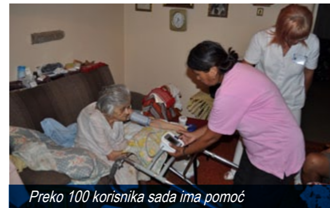
Preko 100 korisnika sada ima pomoć

Beočin je opštinsko mesto na severnoj padini Fruške gore, na obali Dunava, gde uspeva grožđe, rado se pije vino, gde se nalazi Beočinska fabrika cementa, ali gde je pored prisutnih svakodnevnih ekonomskih teškoća jedan od najakutnijih problema prisustvo velikog broja ostarelog stanovništva u opštoj populaciji. U selima oko Beočina to su ostarela bračna ili samačka domaćinstva, čija su deca migrirala u veće gradske centre, a u samom Beočinu su, takođe, ogroman procenat starih i usamljenih u stanovima kojima je neophodno pružanje mnogobrojnih usluga da bi živeli dostojanstvenije.