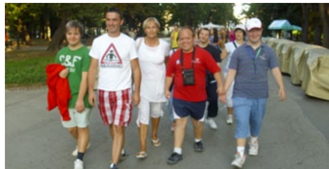
Osobe sa invaliditetom sada su uključene u zajednicu

Opština Savski Venac u partnerstvu sa Asocijacijom za promovisanje inkluzije Srbije i Srpskim Demokratskim forumom realizuje projekat „Pomoć u kući – podrška socijalnom uključivanju osoba sa invaliditetom”. U okviru ove usluge dve IRL osobe su zaposlene kao asistenti u pružanju podrške osobama sa invaliditetom i njihovim porodicama. Najveći broj korisnika ove usluge do sada nije imalo priliku da participira ni na kakav način u događanjima svoje lokalne zajednice već su uglavnom ograničeni na druženje sa članovima svojih porodica. Gotovo svi korisnici su na prvoj evaluaciji okarakterisali ovu uslugu kao otvaranje vrata u svet!