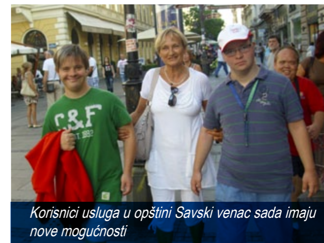
Korisnici usluga u opštini Savski venac sada imaju nove mogućnosti

"Ovaj projekat je odličan jer je doneo nove stvari u živote dece i dao im je volju da se bore i idu kroz život sa osmehom, bez obzira na veličinu problema koji ih muči. Ovaj projekat takođe i roditeljima daje više vremena da pozavršavaju svoje obaveze van kuće. Svi zaposleni su veoma prijatni, profesionalni i spremni na saradnju. Posebno mi se sviđa što su aktivnosti Dnevnog centra promenile rutinu koji je moj sin imao svakog dana svog života. Sada je njegov život bogatiji i aktivniji. Mislim da je ovo sjajan projekat, i još jedan pokazatelj kako male stvari čine život mnogo lepšim. Nadam se da će ovo prerasti u nešto stalno jer bi to svima mnogo značilo", reči su jednog roditelja čije dete koristi usluge Dnevnog centra uspostavljenog u jednom od opštinskih projekata.