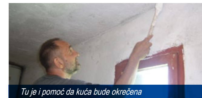
Tu je i pomoć da kuća bude okrećena