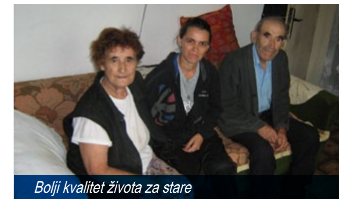
Bojji kvalitet života za stare

Realizacijom projekta „Unapređenje prava, zapošljavanja i životnih uslova izbeglih i interno raseljenih lica u Srbiji“, od 1. juna 2012. godine otpočelo je unapređenje usluge pomoći u kući starim i invalidnim licima na teritoriji opštine Batocina.