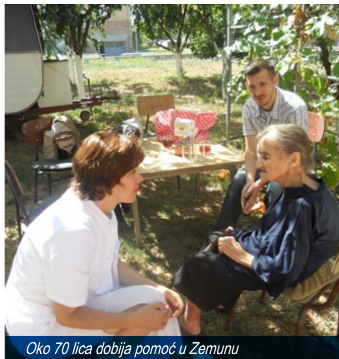
Oko 70 lica dobija pomoć u Zemunu

privremeno raseljenih i sa evidencije Nacionalne službe za zapošljavanje. Vrlo brzo su stvoreni uslovi za njihov rad na terenu, u domaćinstvima. Posle edukacije, izbora uniformi i kupovine terenskog vozila, po svim naseljima Zemuna prijavljeno je više desetina korisnika, a projektom je predviđeno da pomoć dobije oko 70 lica. Po sistemu preporuke, ovaj se broj brzo popunio. Trenutno se njih jedanaestoro trude da pruže pomoć u kući, prave društvo, razgovaraju, savetuju, pomažu nemoćnima da obave svoje administrativne poslove, uz pomoć terenskog vozila koje im je na raspolaganju.