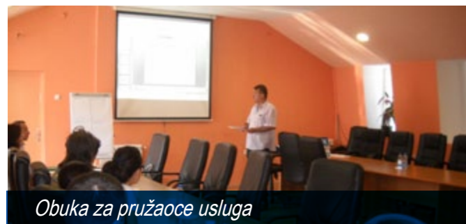
Obuka za pružaocce usluga

Opština Bela Palanka je jedna od najnerazvijenih opština u Republici Srbiji, sa veoma lošom privrednom strukturom. Prema podacima Nacionalne službe za zapošljavanje, ukupan broj nezaposlenih na teritoriji