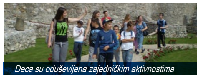
Deca su oduševljena zajedničkim aktivnostima

Opština Žabari, u partnerstvu sa Centrom za socijalni rad opštine Žabari i udruženjem "Centar za društveno ekonomski razvoj" iz Jagodine, počela je u decembru 2011. god. sa realizacijom projekta „Korak ka inkluziji“ koji finansira Evropska unija.