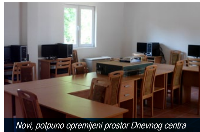
Novi, potpuno opremljeni prostor Dnevnog centra

Dnevni centar radi prema rasporedu pet dana, nedelja i subota su obavezni dani kada korisnici imaju najviše vremena. Radno vreme je usklađeno prema potrebama i željama korisnika. Izgradnjom i funkcionisanjem dnevnog centra stvorile su se mogućnosti starijem stanovništvu da se u prijatnom okruženju bolje upozna i kvalitetno provede slobodno vreme.