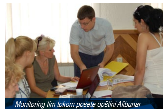
Monitoring tim tokom posete opštini Alibunar

"Nikad ranije ni od koga nisam dobio pomoć. Svog sina nisam izveo iz stana godinama. Dolasci ove gospođe (pružalac usluge) pružaju mi ne samo logističku podršku koja mi je očajnički trebala već i nadu da ljudi sa invaliditetom i njihove porodice nisu u potpunosti ignorisani od strane društva", kaže otac 30-godišnjeg momka obolelog od cerebralne paralize.