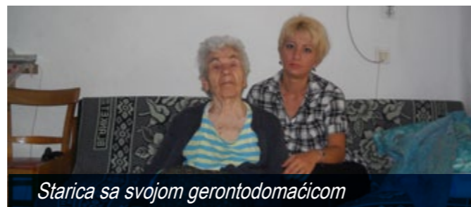
Starica sa svojom gerontodomaćicom

opštine Bela Palanka je 2.792 lica, od čega 1.339 žena. Na teritoriji opštine postoji jedan kolektivni centar u kome je smešteno 107 lica, od čega 73 interno raseljena lica i 34 izbegla lica, dok u privatnom smeštaju živi ukupno 61 izbeglo i interno raseljeno lice. Problemi sa kojima se suočavaju izbeglice i IRL su siromaštvo i visoka stopa nezaposlenosti, neregulisan legalni status, stambeni problem, nedostatak celovite baze podataka o realnom, socijalnom i ekonomskom statusu.