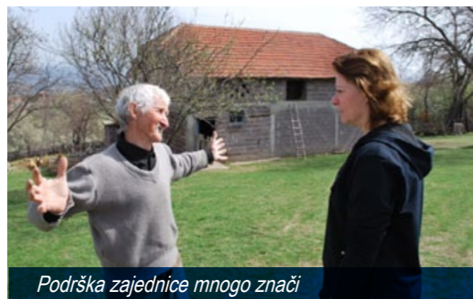
Podrška zajednice mnogo znači

Dosadašnji sveukupni rezultati projekta "Otvorena vrata" pokazuju da je u velikoj smeri smanjena društvena i socijalna isključenost raseljenih lica u aleksinačkoj opštini. Izgradjeno poverenje sa korisnicima, poboljšanje položaja raseljenih lica koji se sve manje osećaju kao građani drugog reda, zajedno sa ostalim projektnim rezultatima predstavljaće oslonac za neke nove projekte i podršku od strane opštine Aleksinac.