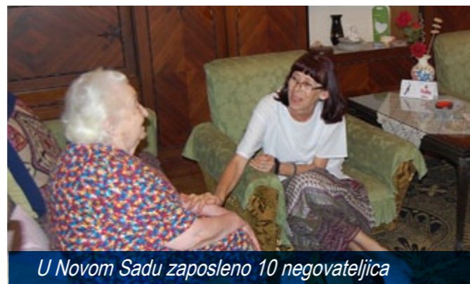
U Novom Sadu zaposleno 10 negovateljica

Grad Novi Sad je u saradnji sa Novosadskim humanitarnim centrom i Centrom za socijalni rad, uz finansijsku podršku Evropske Unije, pokrenuo projekat "Usluge kućne nege u kući u Novom Sadu". Na projektu je zaposleno 10 negovateljica - 5 interno raseljenih žena sa Kosova, korisnika novčane socijalne pomoći koje su u okviru projekta prošle akreditovanu obuku; i 5 žena sa prethodnim