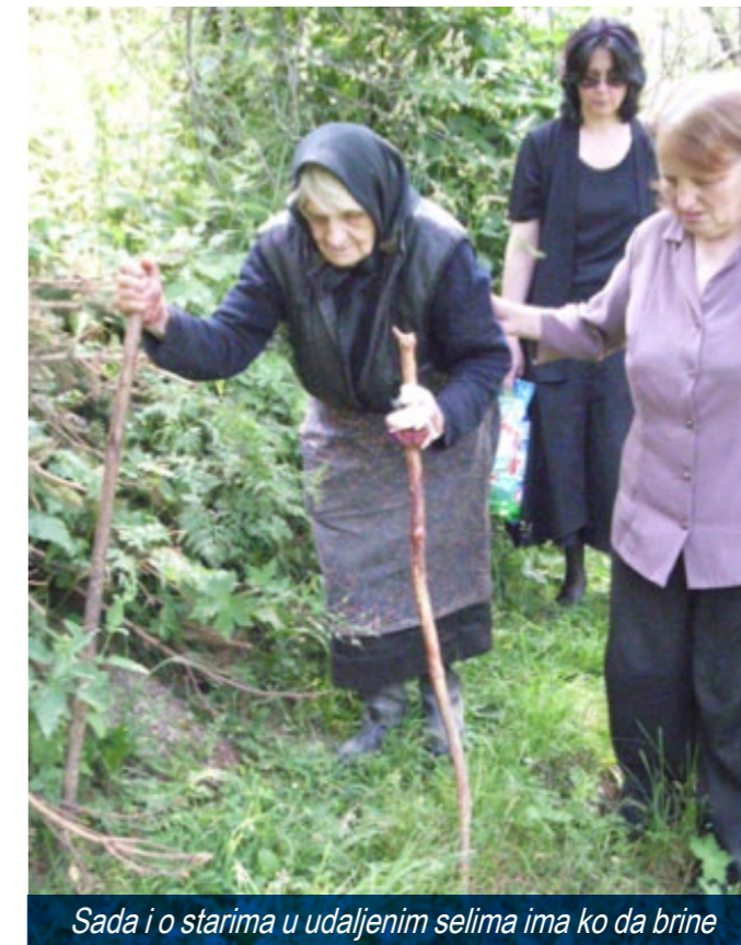
Sada i o starima u udaljenim selima ima ko da brine

mladima, psiholoških radionica i brojnih drugih sadržaja: proslava rođendana, muzičkih nastupa i gostovanja, predstava, javnih manifestacija, vožnje kočijama i jahanja konja... Deca su ohrabrena za brojne životne sadržaje, muzičko - dramsko stvaralaštvo i kreativno izražavanje (sama su izradila preko 250 kreativnih radova), za fizičku aktivnost i mobilnost, za igru i ples, takmičarski duh, druženje, komunikaciju i drugo.