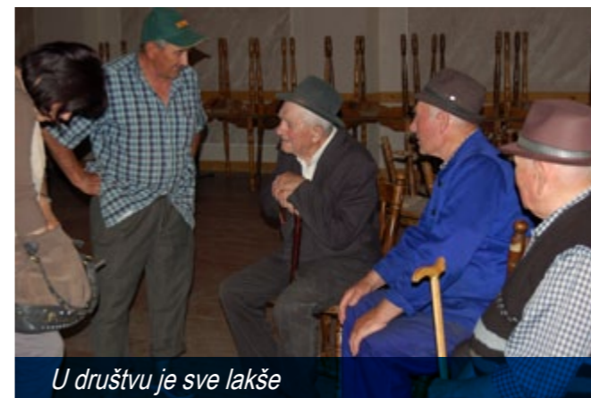
U društvu je sve lakše

Kada čovek dođe u određeno životno doba ili zbog bolesti nije više u mogućnosti da sve obavlja sam, potrebna mu je pomoć. Stari, slabo pokretljivi, nemoćni i bolesni u Alibunaru nisu sami. Naprotiv, 11. aprila dobili su mogućnost da uz pomoć asistenata žive ugodnije i to na mestu gde se osećaju najudobnije - u vlastitim domovima. Kroz uslugu pomoć u kući oni su dobili ne samo pomoć, već i podršku, lepu reč, a neki i prijatelje za ceo život. Nekima je potrebno skuvati ručak, nekima doneti namirnice, lekove, novine, platiti račune, odvesti ih do lekara, a nekima je dovoljno samo da ste tu.