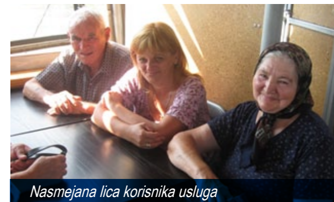
Nasmejana lica korisnika usluga

Projektom je planirano da se kroz dodatnu edukaciju