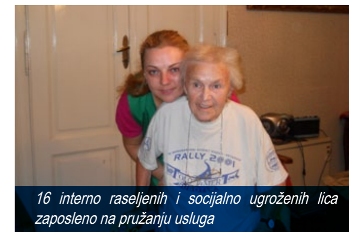
16 interno raseljenih i socijalno ugroženih lica zaposleno na pružanju usluga

Efekti projekta su veoma značajni za krajnje korisnike. Svakog meseca oko 300 najstarijih sugrađana koristi neke od pruženih usluga i sve je teže zadovoljiti sve zahteve, kojih je svakim danom sve više. Kako se približava kraj projekta sve je izraženija nada kako kod korisnika tako i kod radnika i predstavnika nosioca projekta da će se naći način da se nastavi sa ovim vidom pružanja pomoći najugroženijima.