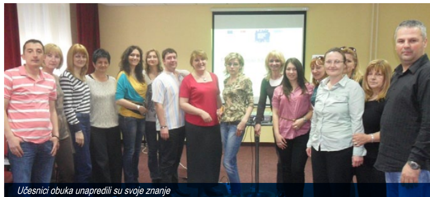
Učesnici obuka unapredili su svoje znanje

Učesnici obuka, odnosno 103 interno raseljena lica, već su našla zaposlenje kao pružaoci usluga u okviru 28 projekata socijalne inkluzije za koje je Evopska unija početkom ove godine dodelila bespovratnu pomoć od 2,6 miliona evra lokalnim samoupravama u Srbiji. Kao što jedan od polaznika obuka zaključuje, "omogućena nam je obuka, uvod u posao i sama mogućnost pronalaska posla."