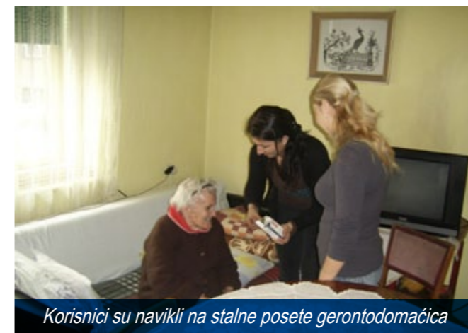
Korisnici su navikli na stalne posete gerontodomačica

Grad Zaječar i Centar za socijalni rad su ovog proleća počeli realizaciju projekta "Jačanje kapaciteta gerontološke službe i proširenje delatnosti na ruralna područja", koji je finansiran sredstvima Evropske unije i grada Zaječara. Program traje godinu dana, a 16 žena gerontodomačica i dva muškarca, koji su angažovani da kao kućni majstori vode brigu o stanovima i okućnicama, uz dva vozača, brinu o 83 domaćinstva sa 98 člana u 17 sela i delu grada Zaječara.