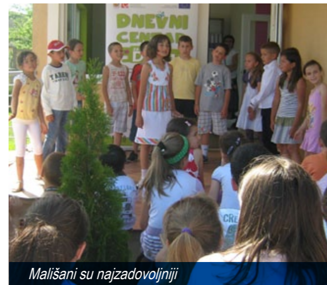
Mališani su najzadovoljniji

I na kraju poruka korisnika: "Ovo nikada nemojte da zaustavite, to je nešto najbolje što nam se desilo u našoj mucu. I zato vam mnogo hvala".