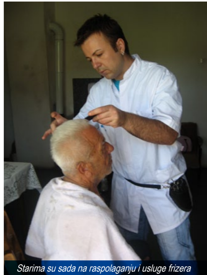
Starima su sada na raspolaganju i usluge frizera