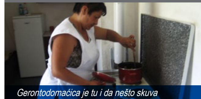
Gerontodomaćica je tu i da nešto skuva

Za korisnike usluge pomoć u kući, koju realizuje 11 gerontodomaćica, od kojih su 5 interno raseljena lica, obezbeđeni su i paketi sa osnovnim higijenskim sredstvima i životnim namirnicama. U cilju većeg stepena integracije, korisnici usluge se uključuju i u manifestacije koje se organizuju na nivou grada (druženja, edukativne radionice, zabavni sadržaji, izleti) u udruženjima, mesnim zajednicama i sl. Okrugli sto je bio prilika da se i udruženja predstave svojim aktivnostima kada su u pitanju ostarela izbegla i inaterno raseljena lica, a tom prilikom definisani su i zajednički planovi.