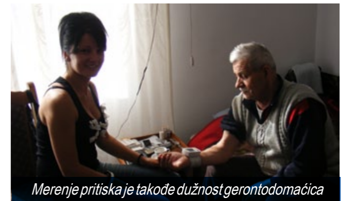
Merenje pritiska je takođe dužnost gerontodomaćica

Na teritoriji te opštine postoji veliki broj staračkih domaćinstava, kojima je neophodna socijalna i zdravstvena pomoć. Samo u udaljenim planinskim selima opštine Kuršumlja živi više od 100 staračkih domaćinstava. Mnogi od njih, zbog velike udaljenosti od grada, loših seoskih puteva, nepostojanja telefonske komunikacije, nemogućnosti da dođu do prvih komšija, nikada nisu bili kod lekara, nemaju zdravstveno osiguranje, nemaju nikakva primanja, često ni lična dokumenta.