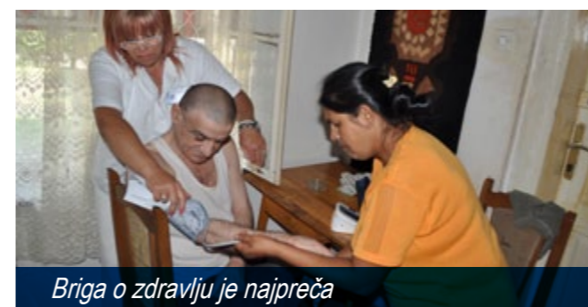
Briga o zdravlju je najpreča

Projekat „Pomoć u kući“ koji realizuje opština Beočin sa svojim partnerima „Udruženjem Roma Beočin“, Novosadskim humanitarnim centrom i Centrom za socijalni rad iz Beočina od početka 2012, upravo je to ponudio ostareloj i onemoćaloj generaciji koja broji preko 100 korisnika - veći broj usluga starima u njihovim stanovima i kućama počevši od pomoći u kretanju, u šetnji, pripremanju obroka, odlasku kod lekara, održavanju higijene, druženja i mnogih drugih aktivnosti koje im olakšavaju život.