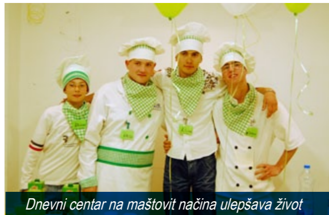
Dnevni centar na maštovit način ulepšava život

Deca i mladi sa smetnjama u razvoju u Temerinu nisu do sada imali svoj prostor. Bili su uskraćeni za kvalitetne dnevne usluge u zajednici, značajne za očuvanje i unapređenje njihovog zdravlja i kvalitetnijeg života. Uz pomoć Evropske unije u prelepoj novoizgrađenoj kući u Temerinu, u maju je otvoren Dnevni centar za decu i roditelje. Dnevni centar je otvoren za svu decu sa smetnjama u razvoju bez obzira na uzrast, pol, vrstu ometenosti, nacionalnost, sposobnosti i kapacitete. Svakodnevno se u kući i dvorištu čuje smeh i radost najmanje 20-tak dečijih glasova a u centru ih je već bilo 60-tak. "Svi smo isti", napisala je mala devojčica, "kada imamo jednake šanse", dodala su druga deca.