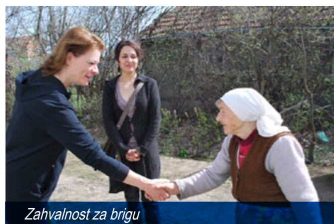
Zahvalnost za brigu

Od decembra prošle godine opština Aleksinac je u prilici da u okviru projekta "Otvorena vrata", podržanog od strane Evropske unije svojim sugrađanima, raseljenim licima sa Kosova i Metohije, pruži više od krova nad glavom. Uvedene su usluge gerontodomačice za ukupno 25 korisnika iz gradske i seoskih sredina, za 19 mališana školskog uzrasta iz raseljeničkih porodica organizovana je pomoć u učenju, uključena je i pomoć psihologa a kao jedna od najznačajnijih usluga je medicinska pomoć korisnicima.