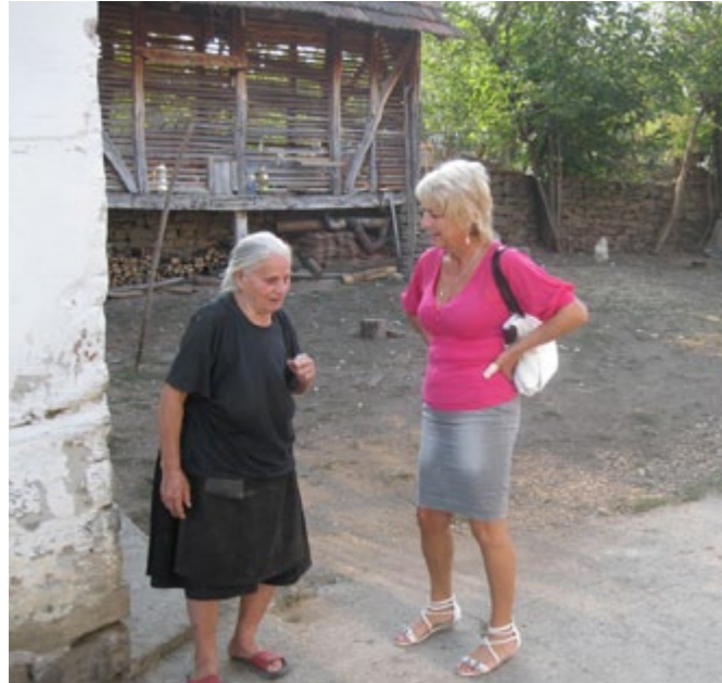
Ova baka sada ima kome da se požali

druže i po celo prepodne sa korisnicima, ako postoji potreba da se korisnik odveze do lekara u dom zdravlja u Bojniku, ili na neki specijalistički pregled u Leskovac, tako da se korisnici prevoze automobilom, pa otuda i kratka anegdota kako je jedan od korisnika rekao da je "počastvovan što ga voze kao predsednika".